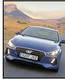
Das Erfolgsmodell Hyundai i30 wird in Deutschland gefertigt.

Die Kleinwagen i10 und i20 rollen im türkischen Werk in Assan vom Band, das seine Fertigungskapazitäten aufgrund eines Ausbaus jüngst sogar verdoppeln konnte. Im