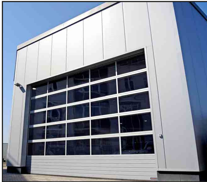
Die erweiterte Werkstatt des Hyundai Autohauses Schmidt verfügt über neueste Technik, moderne Hebebühnen und natürlich auch über Elektrozapfsäulen.

Der Hyundai IONIQ Hybrid (Kraftstoffverbrauch in l/100 km innerorts 3,9-3,4, außerorts 3,9-3,6, kombiniert 3,9-3,4; CO 2 -Emissionen in g/km kombiniert: 92-79) weist mit rund 1.550 Bestellungen erwartungsgemäß den größeren Bestellanteil innerhalb der Baureihe auf. Beim Hybrid beginnt die unverbindliche Preisempfehlung bei 23.900 Euro.