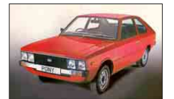
Mit „Pony“ fing alles an.

Autohaus Schmidt , Inh. Oliver Hauck, Riegeler Straße 9, 07 61/45 51 00, www.autohaus-schmidt.de