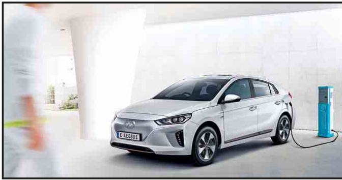
Seit verganginem Herbst auf dem Markt: Fast jeder zweite Hyundai IONIQ wird als Elektroauto verkauft.