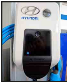
Die neue Werkstatt bei Hyundai Schmidt verfügt über Elektrozapfsäulen.

Als erster Automobilhersteller brachte das Unternehmen mit der völlig neu entwickelten fünftürigen Fließhecklimousine IONIQ jüngst ein Modell auf den Markt, das gleich für drei unterschiedliche alternative Antriebssysteme konzipiert wurde. So rollen die Modelle der Baureihe als Hybrid-, Plug-in-Hybrid- und reine Elektro-Variante auf den Markt. Den Anfang machte die Hybrid-Version mit einer Systemleistung von 104 kW (141 PS) sowie neuerdings die rein batteriebetriebene Elektro-Ausgabe mit einer Leistung von 88 kW (120 PS). Noch in diesem Jahr wird der Plug-in-Hybrid folgen, der dank aufladbarer Akkus bis zu 50 Kilometer weit